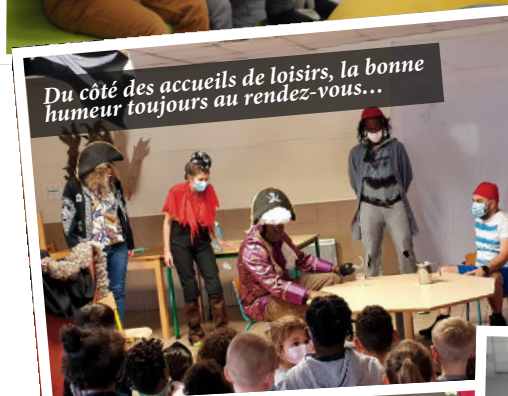
Du côté des accueils de loisirs, la bonne humeur toujours au rendez-vous...