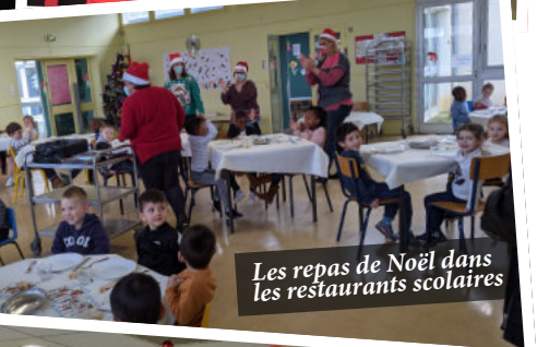
Les repas de Noël dans les restaurants scolaires