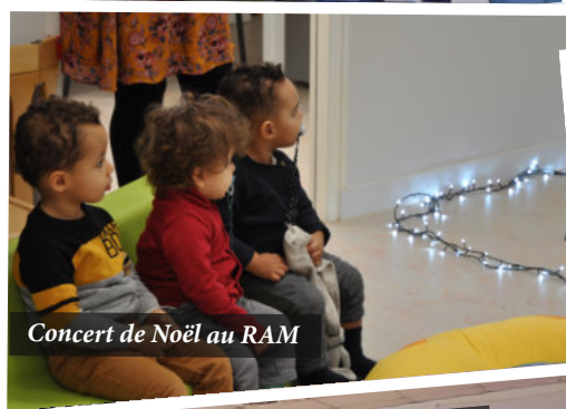
Concert de Noël au RAM