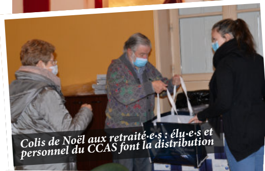
Colis de Noël aux retraité-e-s ; élu-e-s et personnel du CCAS font la distribution