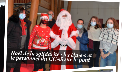
Noël de la solidarité : les élu-e-s et le personnel du CCAS sur le pont