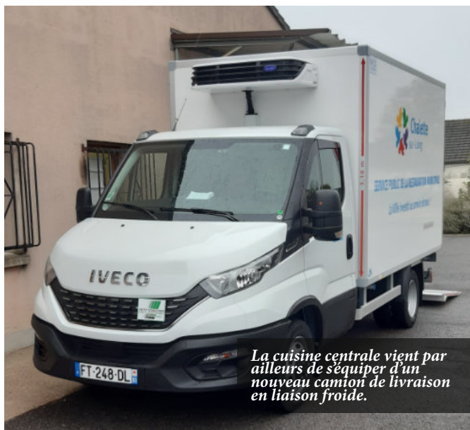
La cuisine centrale vient par ailleurs de s'équiper d'un nouveau camion de livraison en liaison froide.

(2) Association nationale de développement des épiceries solidaires.